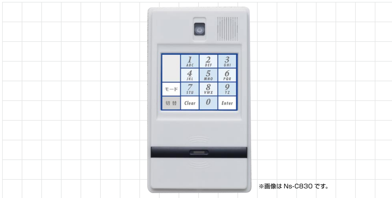
※画像は Ns-C830 です。

■ご注文名：LED 表示型カード照合機 / 液晶表示型カード照合機 Ns-C810/Ns-C830 [取扱商品] ■価格表 435